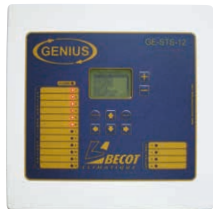
GE STS 8/12

Equipés de touches de menu rapide et de touches de réglage, ces régulateurs sont simples d'utilisation et complets dans le fonctionnement.